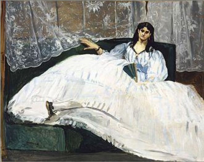
Jeanne Duval, amante de Baudelaire cuando este tenía 21 años.